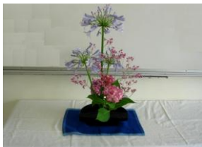
いつも会場が和みます