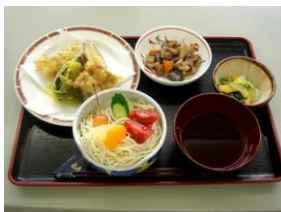
いつも美味しいです