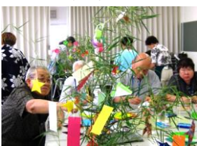
皆さんの願は何でしょう!